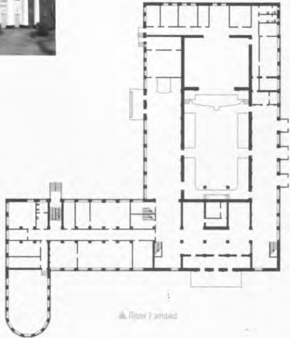
▲ План 7 этажа