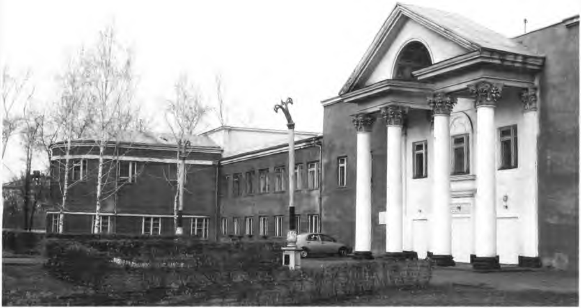
▲ Дворец культуры имени Артема. 1933